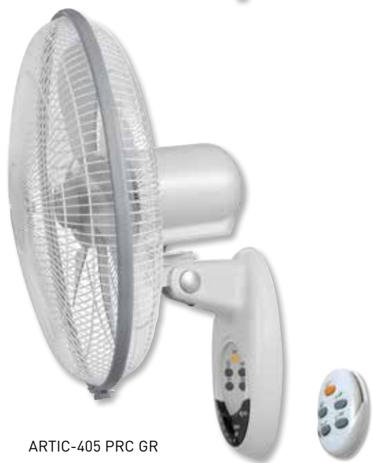
ARTIC-405 PRC GR

Ventiladores de pared que proporcionan gran caudal de aire de manera silenciosa.