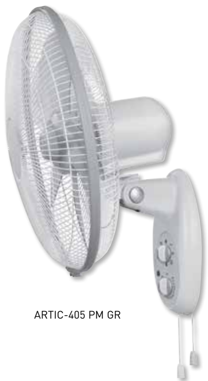
ARTIC-405 PM GR