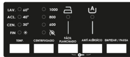
SL7000DTD / 7 kg / 1000 rpm