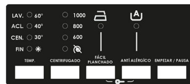
SL8000DTD / 8 kg / 1000 rpm